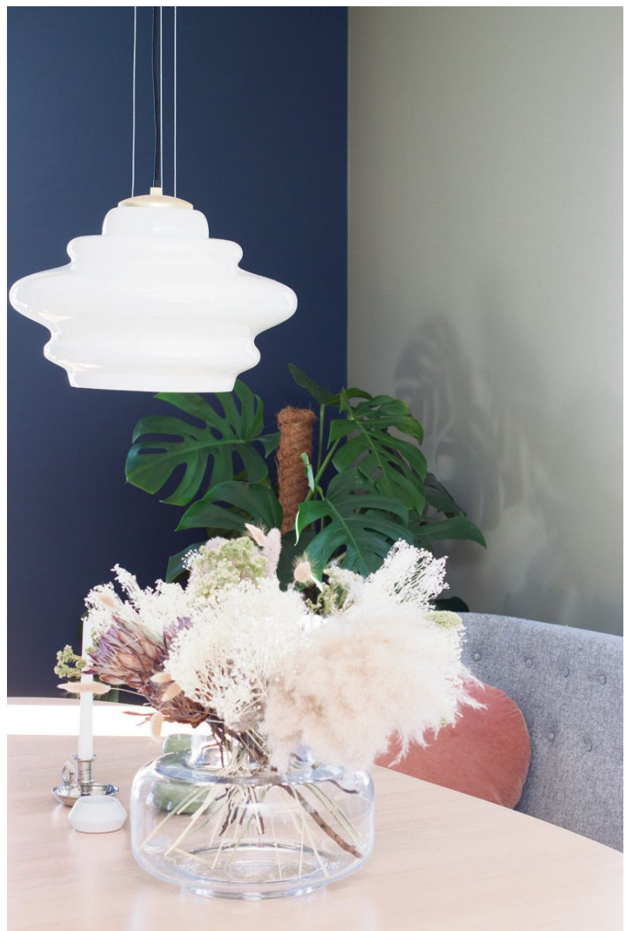
Skulptur: Glasskuppelen over spisebordet blir som en hvit skulptur i vakker kontrast mot veggene i blått og grønt.