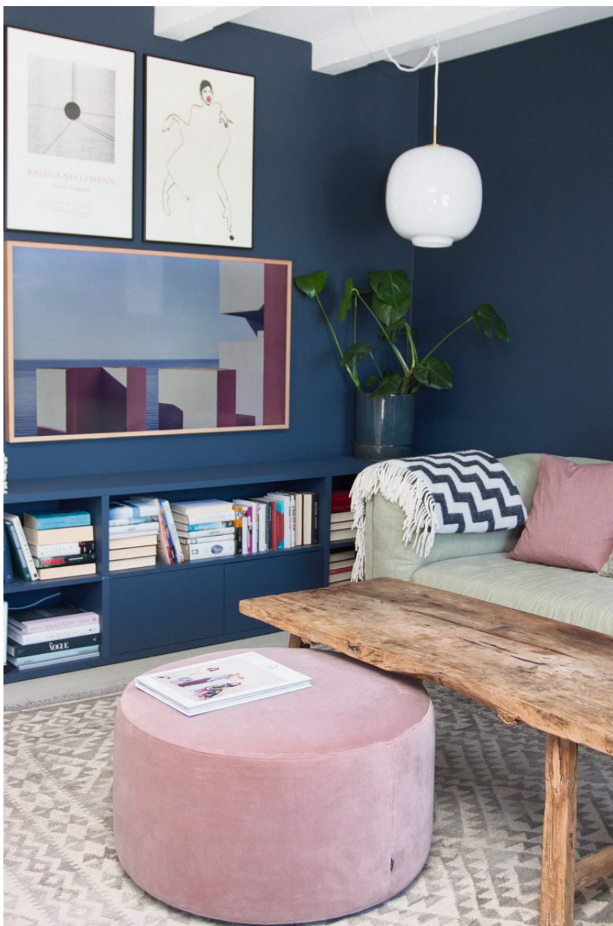
Tips: Fargebruk handler om mer enn veggfargen i de ulike rom. - Inkluder alle elementene i rommet som en del av fargepaletten du setter opp, er ett av tipsene Pernille kommer med denne reportasje.

Hvorfor: Pernille stakk av med én av prisene som ble delt ut da interiørfolket på Instagram møttes til workshop, seminar og prisutdeling under arrangementet Gullfjæren i mars.