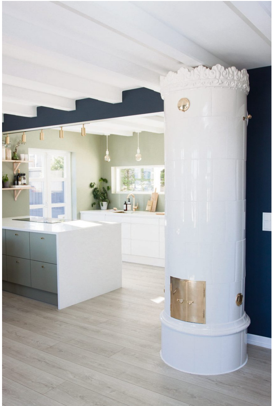
Delt identitet: Kakkellovnen forsterker husets tilknytning til byggeåret, mens kjøkkenet i bakgrunnen forteller om en modernisering som skjedde 100 år etter.