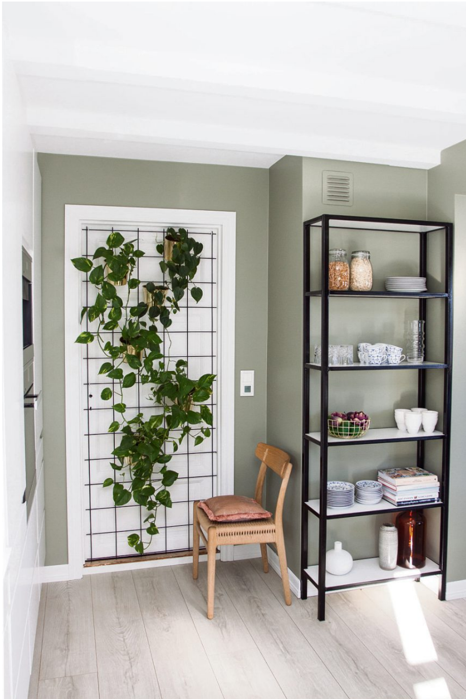
Plantevegg: En gammel dør inn til kjøkkenet er ikke i bruk, og har blitt til en plantevegg ved hjelp av en bit armeringsnett og krukker som henger på nettet.